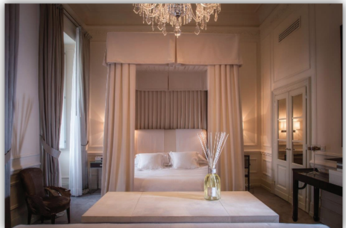
Hotel J.K. Palace, Florencja