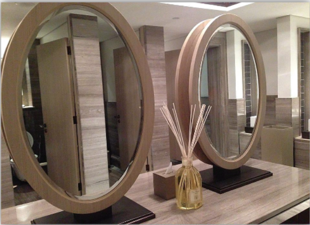
Hotel The St. Regis - Saadiyat Island, Abu Dhabi