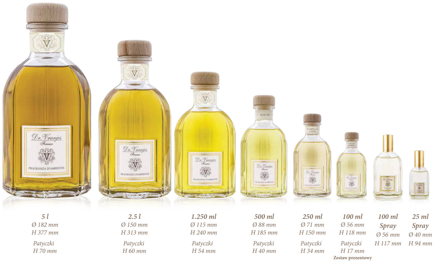
500 ml uzupełnienie zapachu

Zapachy do wnętrz Dr. Vranjes Firenze są dostępne w różnych rozmiarach