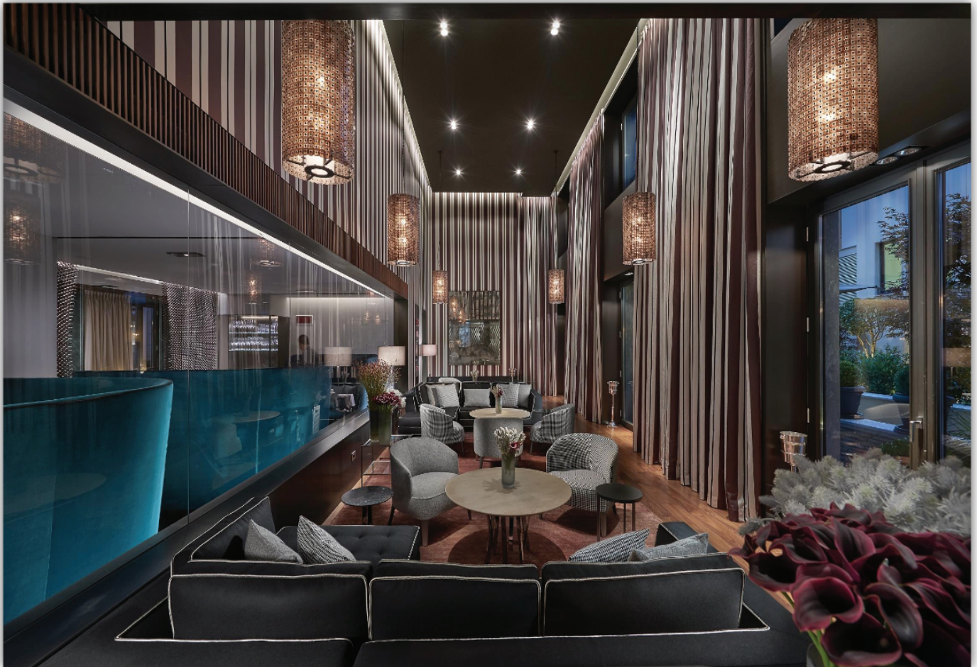
Hotel Mandarin Oriental, Mediolan