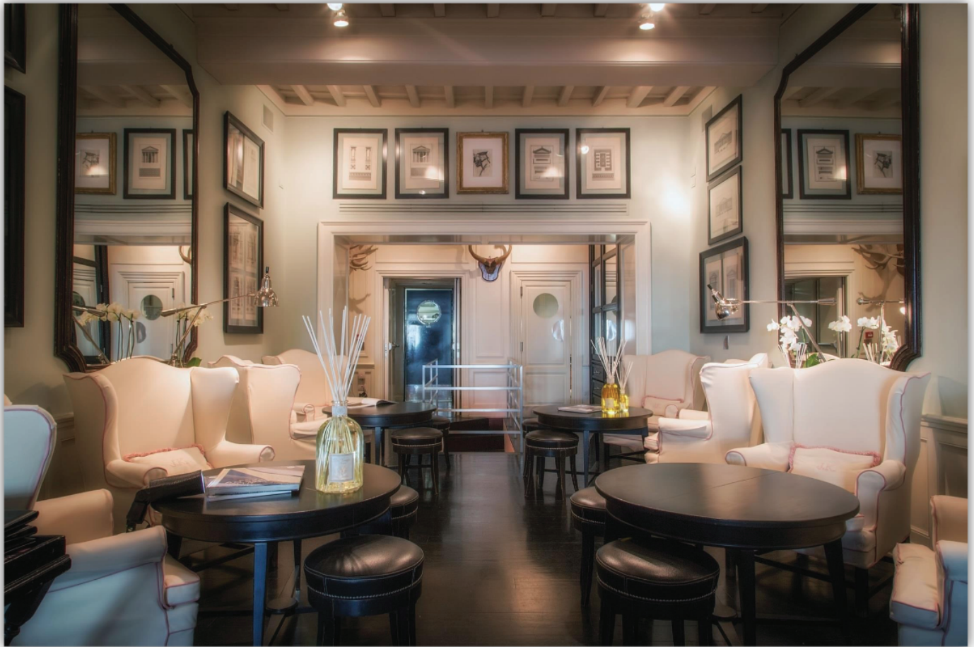
Hotel J.K. Palace, Florencja