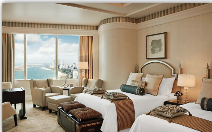
Hotel The St. Regis - Saadiyat Island, Abu Dhabi