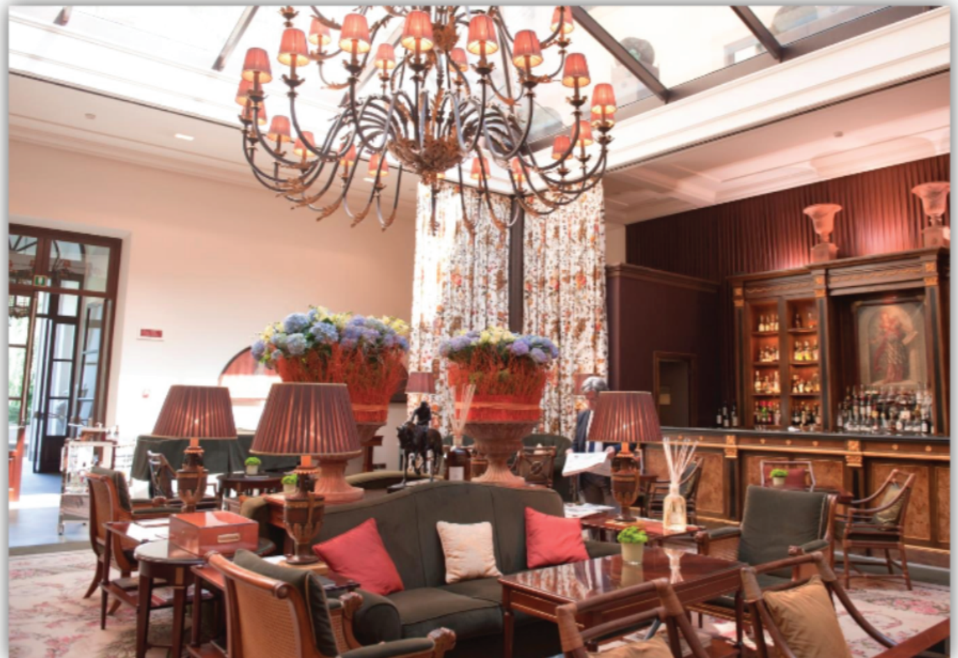
Hotel Four Season, Florencia